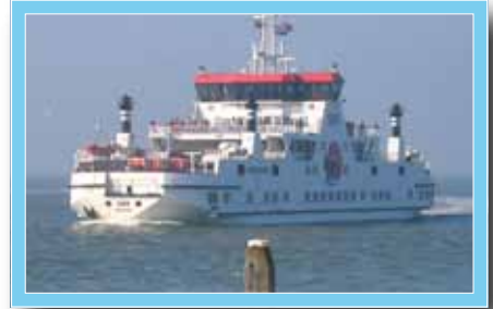
Da ist sie auch schon ...