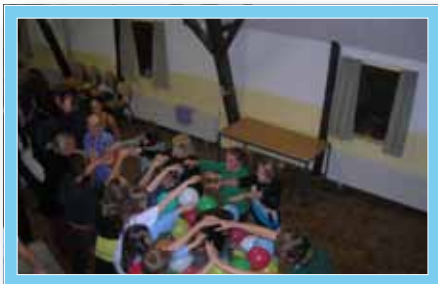
Für eine Woche unser Heim ...