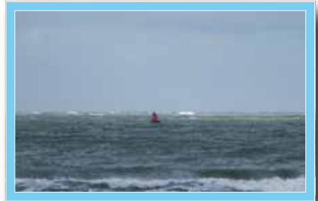
Der Blick zurück zum Festland ...