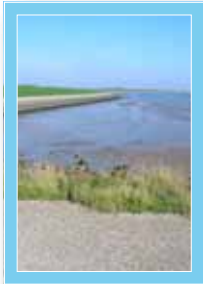
Richtung Ameland ...