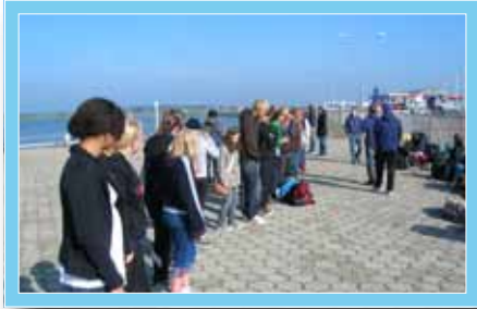
Warten auf die Fähre ...