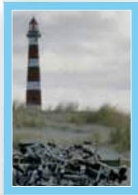
Er weist den Weg ...