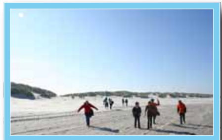
Herrlich diese Weite und Frische ...