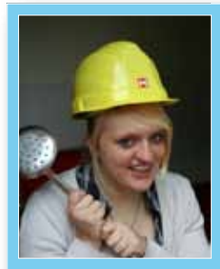
„Das Schwarze Brett“