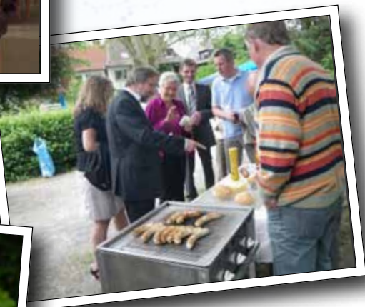
Auch Pfarrer mögen Würstchen vom Grill