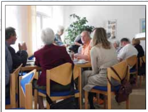
Gemeinsames Kaffeetrinken im Fliednerhaus

Der große Gewinn eines ökumenischen Festes ist oft die Begegnung von Nachbarn unterschiedlicher Konfessionen, die sich eigentlich viel mehr zu sagen hätten, als es im Alltagsleben zum Ausdruck kommt. Hier hat man die Chance, sich über und durch den christlichen Rahmen näher zu kommen und Vorurteile aufzugeben. Plötzlich grüßen sich mehr Leute eines Stadtteils, die sich sonst nur vom Ansehen kannten.