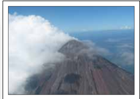
„Das ist der Mayon, der im letzten Jahr wieder Kummer gemacht hat ...“