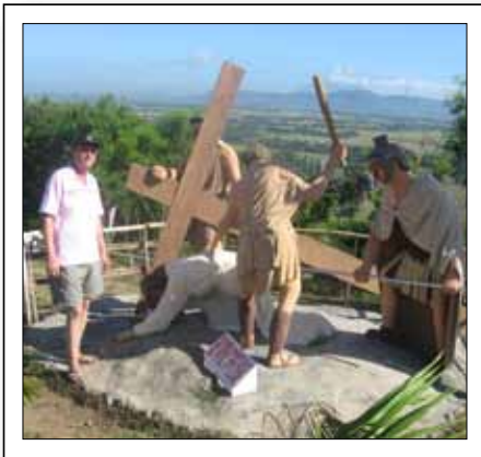
„So sieht ein philippinischer Kreuzweg aus ...“