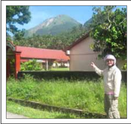
„Das ist der Bulusan-Vulkan ...“