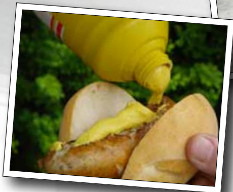
Bekommen Sie Appetit auf die Teilnahme beim nächsten Mal?