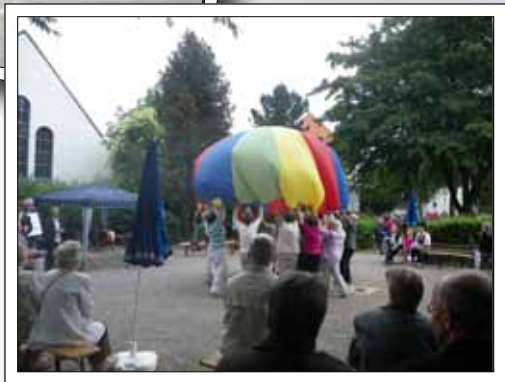
Seniorinnen-tanz? Wer hätte das gedacht!