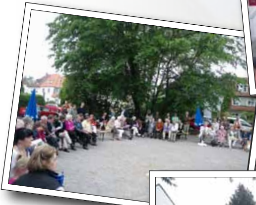
„Freies Singen“ auf dem „Roten Platz“