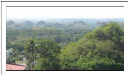
„Das sind die Schokoladenberge über deren geologischen Ursprung Unklarheit herrscht ...“