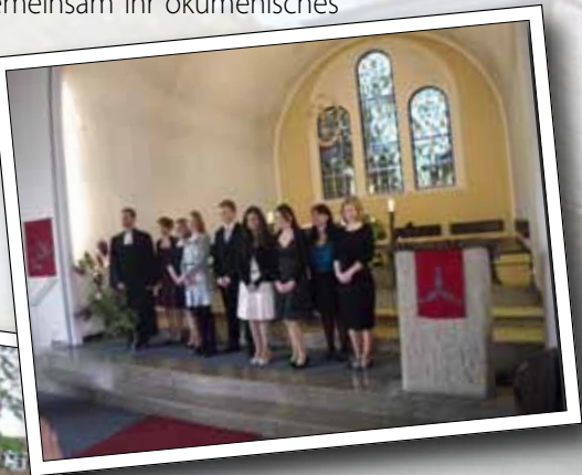
Pfarrer und Mitwirkende im Altarraum

Die Gemeinden auf der Geist feierten gemeinsam ihr ökumenisches Fest am 13. Juni in und um die Trinitatiskirche herum - Schwerpunkt: „Roter Platz“. Das gemeinsame Tanzen und Singen dort entwickelte sich besonders eindrücklich.