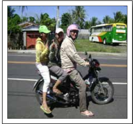
„Das ist meine Begleitung ...“